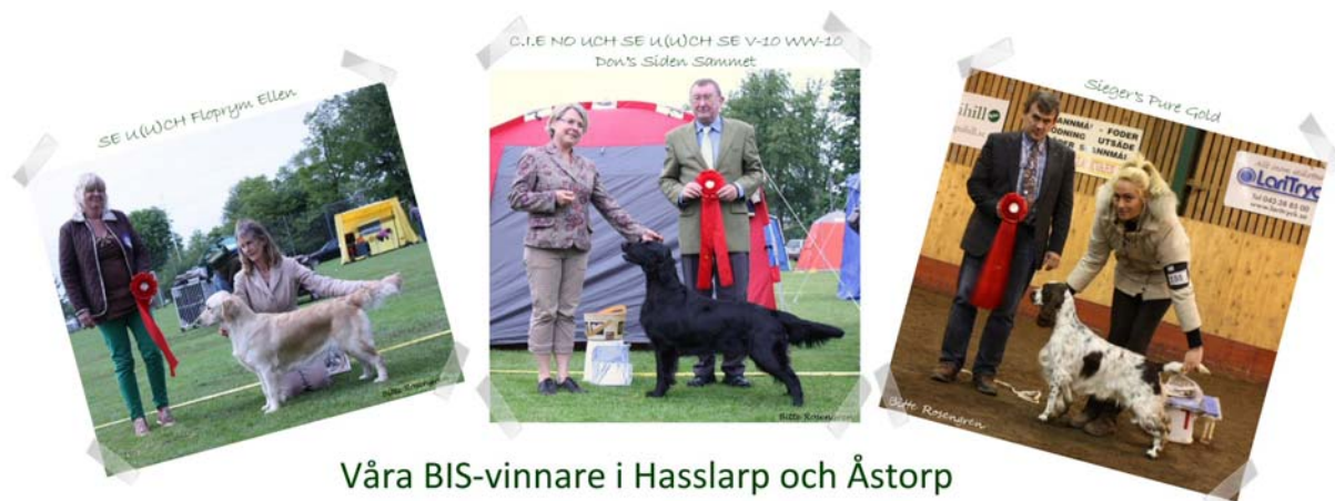
Våra BIS-vinnare i Hasslarp och Åstorp

Utställningskommittén har haft tre möten under året