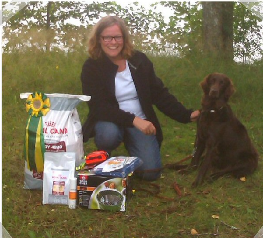
SE VCH Spader Damens Quick Quant Quail