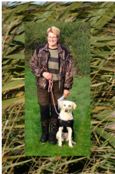
SE J(J)CH Seareeds Daisy